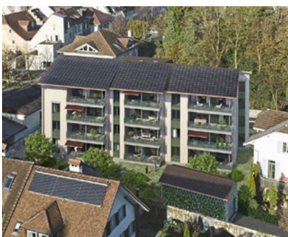
Mehrwert Eco, Sursee