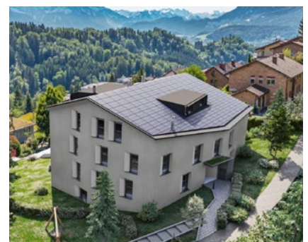
Prisma 7, Luzern